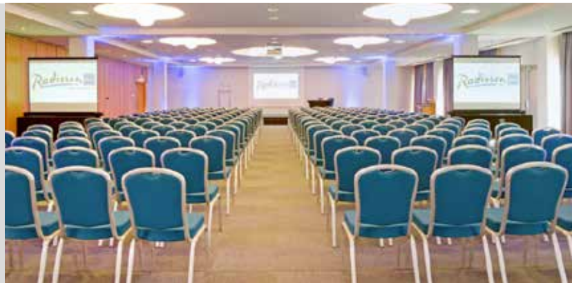
RADISON BLU HOTEL - TOULOUSE AIRPORT

DATE Samedi 28 mars 2026 LIEU RADISON BLU HOTEL TOULOUSE AIRPORT 2 rue Dieudonné Costes 31700 BLAGNAC (Parking)